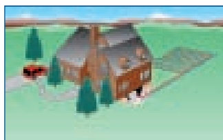
Système géothermique à boucle fermée horizontale