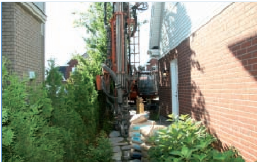
La géothermie à expansion directe utilise une technique de forage moins invasive qui permet de s'approcher plus près des fondations. Le procédé se fait sans eau et ne produit pas de boue de forage.