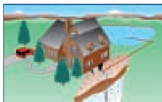
Système géothermique à boucle ouverte