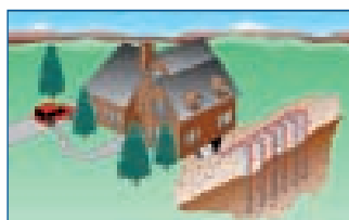
Système géothermique à boucle fermée verticale