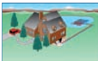
Système géothermique à boucle de lac ou d'étang

Selon les spécialistes en géothermie, la profondeur ou la longueur d'une boucle dépend du tonnage requis pour chauffer et climatiser une habitation ainsi que de la conductivité du sol. Plus les charges de chauffage et de refroidissement sont élevées, plus la boucle doit être étendue ou profonde. Plus un sol est dense et humide, plus il favorise l'échange thermique.